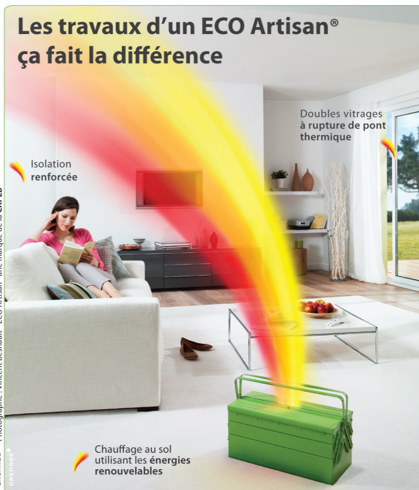
GRENNELLE® - ECO Artisan® - une marque de la CAPEB

JOEL ROLLAIS Plomberie chauffage electricite menager 20, rue de Guémené 44630 PLESSE T. 02 40 51 83 68