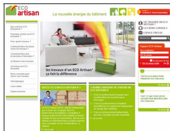
L'espace grand public

2) L'espace grand public : Véritable vitrine de la marque auprès des particuliers, il propose toutes les informations nécessaires pour entreprendre des travaux de rénovation énergétique. Conçu pour guider et accompagner le particulier depuis la conception de son projet jusqu'à la réalisation finale des travaux en passant par leur financement, www.eco-artisan.net se veut une référence et un facilitateur. En quelques